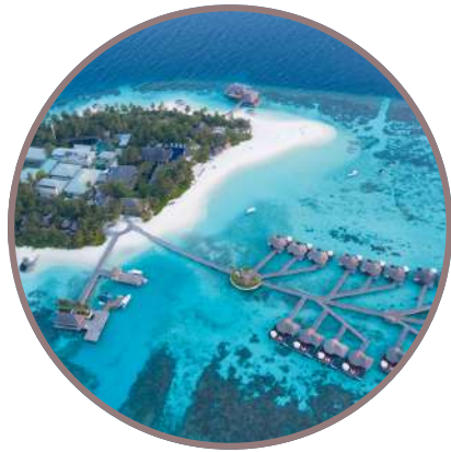
NUEVA ZELANDA & FIJI