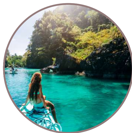
SINGAPUR & FILIPINAS