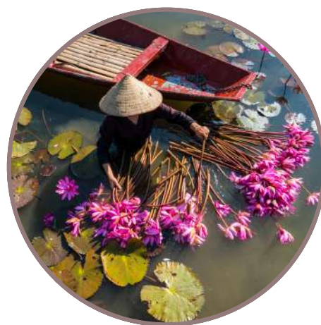
VIETNAM LAOS & CAMBOYA