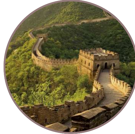
CHINA & HK