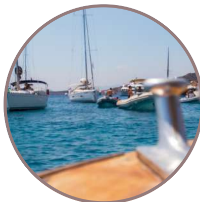
CÓRCEGA & CERDEÑA