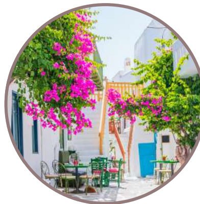
GRECIA & CROACIA