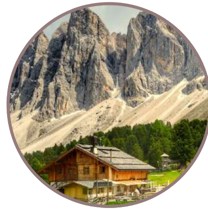
DOLOMITAS Y MÁS DE ITALIA