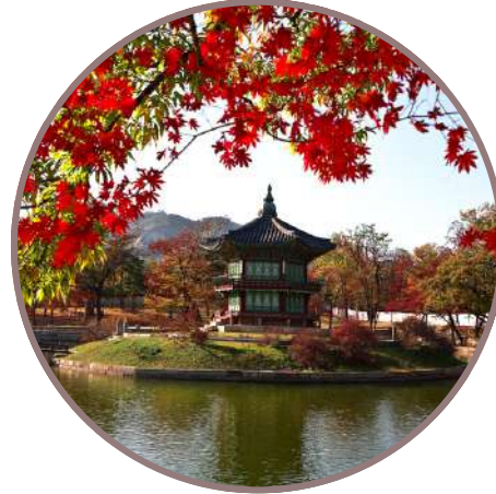
COREA DEL SUR