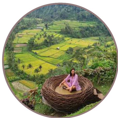
BALI & GILI