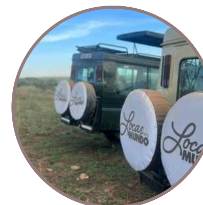
KENYA, TANZANIA & ZANZIBAR