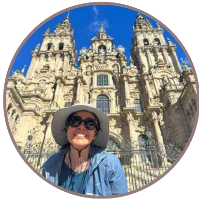
CMNO DE SANTIAGO & NORTE ESPAÑA