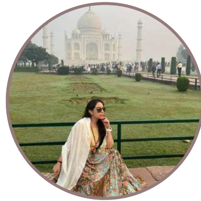
INDIA & BALI