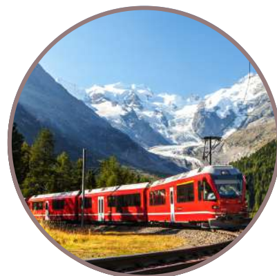
SUIZA & EL DANUBIO