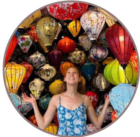
VIETNAM, CAMBOYA Y LAOS